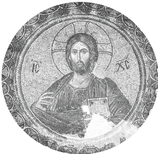
Христос Сегржштел, мозаик, црква „Света Софија“, Истанбул, Турција, 13 век

јата рака исполнета со исцеление и здравје, и подигни го од постелата и исцели ја неговата болест. Отстрани го од него духот на болеста и секоја болка, мака и треска со која е врзан, и ако има направено гревови и прегрешенија, дарувај му отпуштање и простување, зашто Ти си човекољубец. Да, Господи, Боже мој, сожали се врз Твоето создание, со милосрдноста на Твојот Единороден Син, заедно со Твојот Сесвет, Благ и Животворен Дух, со Кој си благословен, сега и секогаш и во вечни векови. Амин.